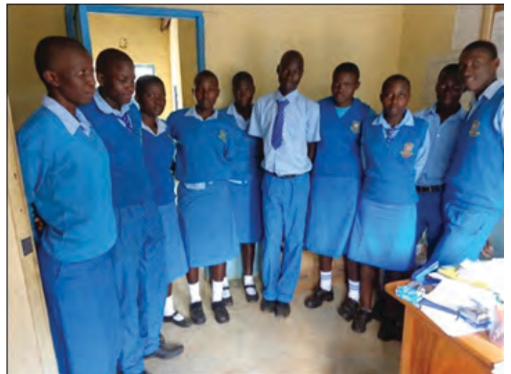
Studenten van de Nyandiwa Secondary School, gesponsord door Imani Belgium, netjes uitgedost in schooluniform.

Ben je geïnteresseerd? Stuur dan snel een email naar info@imanibelgium.org en je krijgt snel respons.