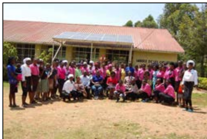
De ganse studentenpopulatie eind 2021

Om hun opleiding officieel te laten erkennen door de overheid, keren ze na de stage dan voor even terug naar Imbeke om zich voor te bereiden op het examen van de overheid (“NITA: National Industrial Training Authority” – nationale autoriteit voor industriële opleiding ; “TVET: Technical and Vocational Education and Training”- technische en beroepsopleiding en training ; “KNEC: Kenya National Examination Council” – nationale examenraad van Kenia ).