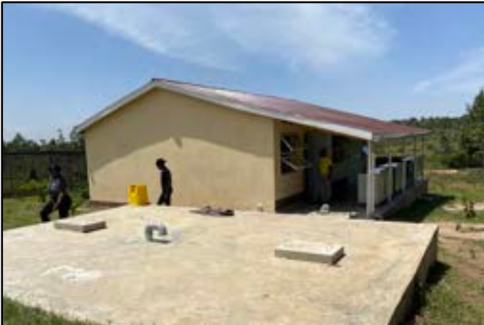
Zicht op het voorlopige internaatgebouwtje en het vorig jaar gebouwde grote ondergrondse waterreservoir

Ten gevolge van de coronapandemie dateren de vorige bezoeken van bestuursleden van Imani Belgium aan het Imbeke centrum van mei 2019. Dus bijna drie jaar geleden. Het was dan ook een grote opluchting het centrum in goede staat terug te zien. Een aantal gebouwen kunnen intussen wel een likje verf gebruiken.