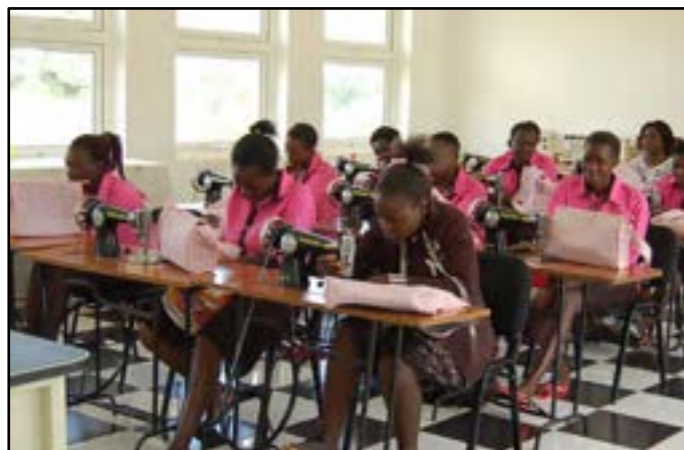
De naaiklas in volle actie

vorig jaar hadden eerder al een universitair diploma gehaald in “mode en ontwerp”. Specialisten dus zagezegd in kledij, maar naar hun eigen zeggen hadden ze geen enkele voeling met de werkelijkheid. Ze kwamen bij Imbeke leren hoe stijlvolle kledij kan ontworpen en gemaakt worden in de praktijk.