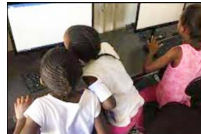
Foto uit Zuid-Afrika. Hopelijk wordt dit nog in 2022 ook werkelijkheid in het Imbeke opleidingscentrum.

We hopen de opstart, of toch minstens de aanzet tot dit alles, te realiseren in 2022.