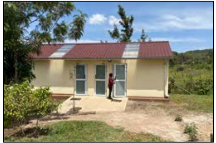
Het nieuwe sanitair gebouw

Dat het centrum een bijzonder grote aantrekkingskracht uitoefent in de omgeving van Oyugis blijkt uit het feit dat een aantal investeerders uit Oyugis huurhuizen voor jonge gezinnen aan het bouwen zijn dicht bij het Imbeke centrum. Nogmaals een bewijs dat het Imbeke centrum een steeds groter succes en steeds grotere aantrekkingspool aan het worden is. Quod erat demonstrandum (wat te bewijzen was).